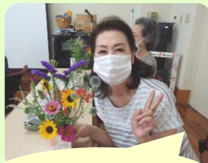
ミニフラワーアレンジメント