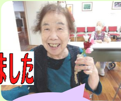
コスモスの花工作