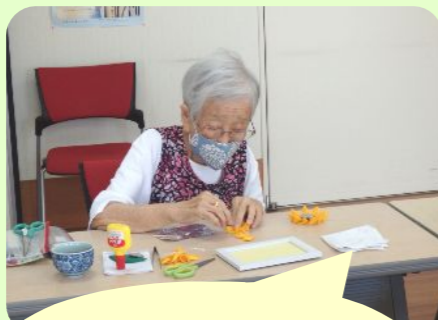
ひまわりのつまみ細工