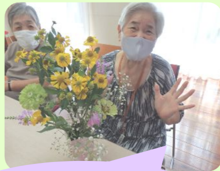
ミニフラワーアレンジメント