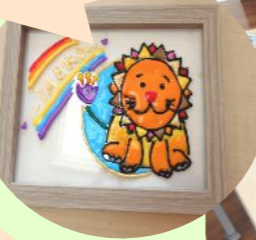
スタンドグラス風塗り絵